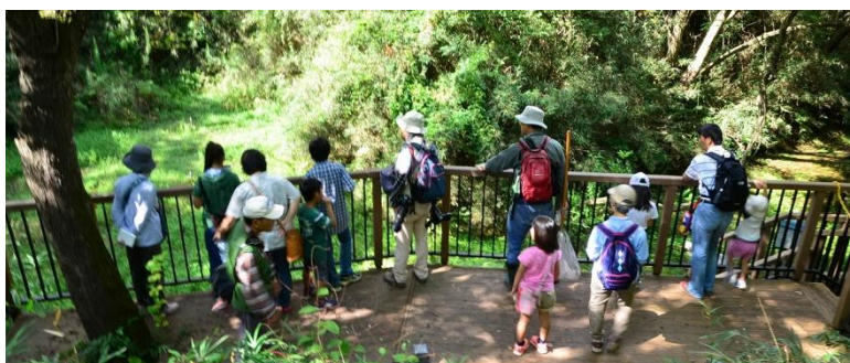
左：沢田湧水地源頭部、中央上：オゼイトトンボ、右上：ツリフネソウ、右下：ネイチャーツアーの様子

国営ひたち海浜公園では、 沢田湧水地の供用に向けて、現地でのガイドやイベント等にご協力いただける「沢田湧水地パートナー」を募集します！