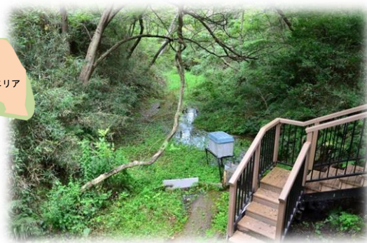
沢田湧水地源頭部 2014年9月17日