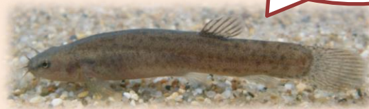
沢田湧水地に生息するホトケドジョウ

「沢田湧水地パートナー」についてのお申込み・お問い合わせ 国営ひたち海浜公園 ひたち公園管理センター 029-265-9001 (担当/事業調整課 地域・市民サポート担当まで)