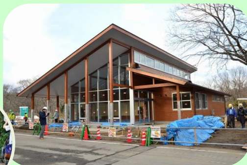
現在建設中のビジターセンター 2015年1月27日撮影