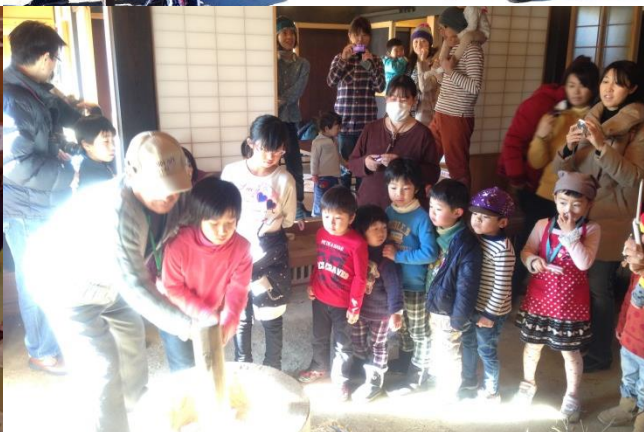
昨年のお正月の様子 2014年1月撮影