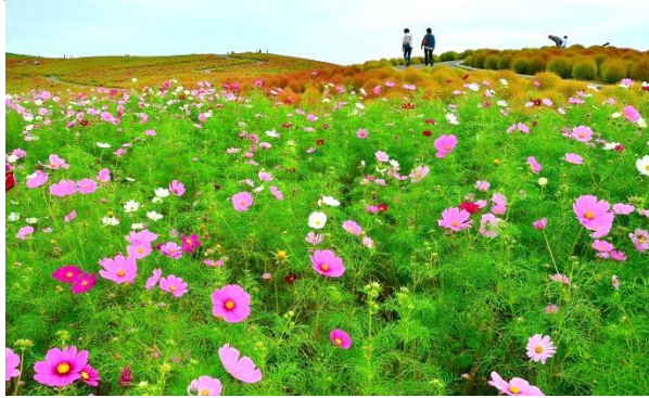
みはらしの丘 2014年10月2日

コスモスは英語で「宇宙」の意味ですが、植物でいうコスモスはギリシア語の「kosmos」に由来し「美しい」という意味です。一重のほか、花びらの付け根に小さな花びらが付くコラレット咲きや花びらが筒状になるユニークな品種もあります。