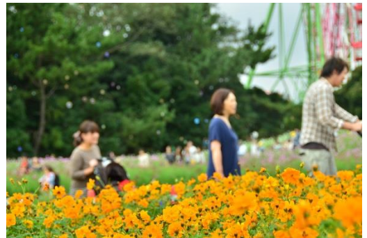
大草原フラワーガーデン 2014年10月2日