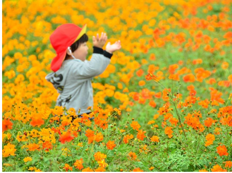
大草原フラワーガーデン 2014年10月2日