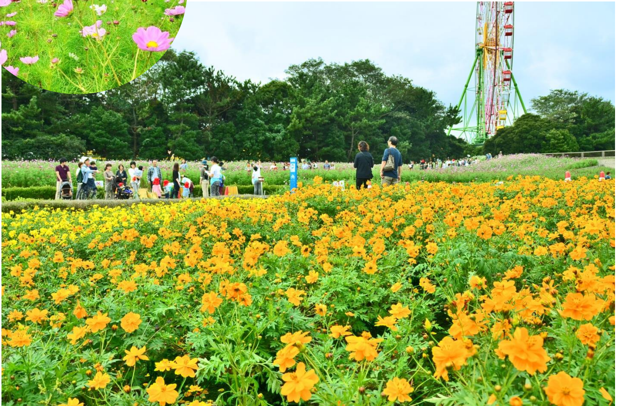
キバナコスモスと、みはらしの丘のコスモス（左上） 2014年10月2日撮影

澄んだ青空のもと、色とりどりの花や紅葉したコキアにより彩られる、国営ひたち海浜公園の秋の花 修景。その代表格でもあるコスモスが間もなく見頃を迎えます！