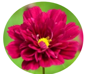
大草原フラワーガーデン 2014年10月2日

⑦ダブルクリック クランベリー 筒状の花弁の半八重~八重咲きとなる珍しい花形の品種です。(下画像)