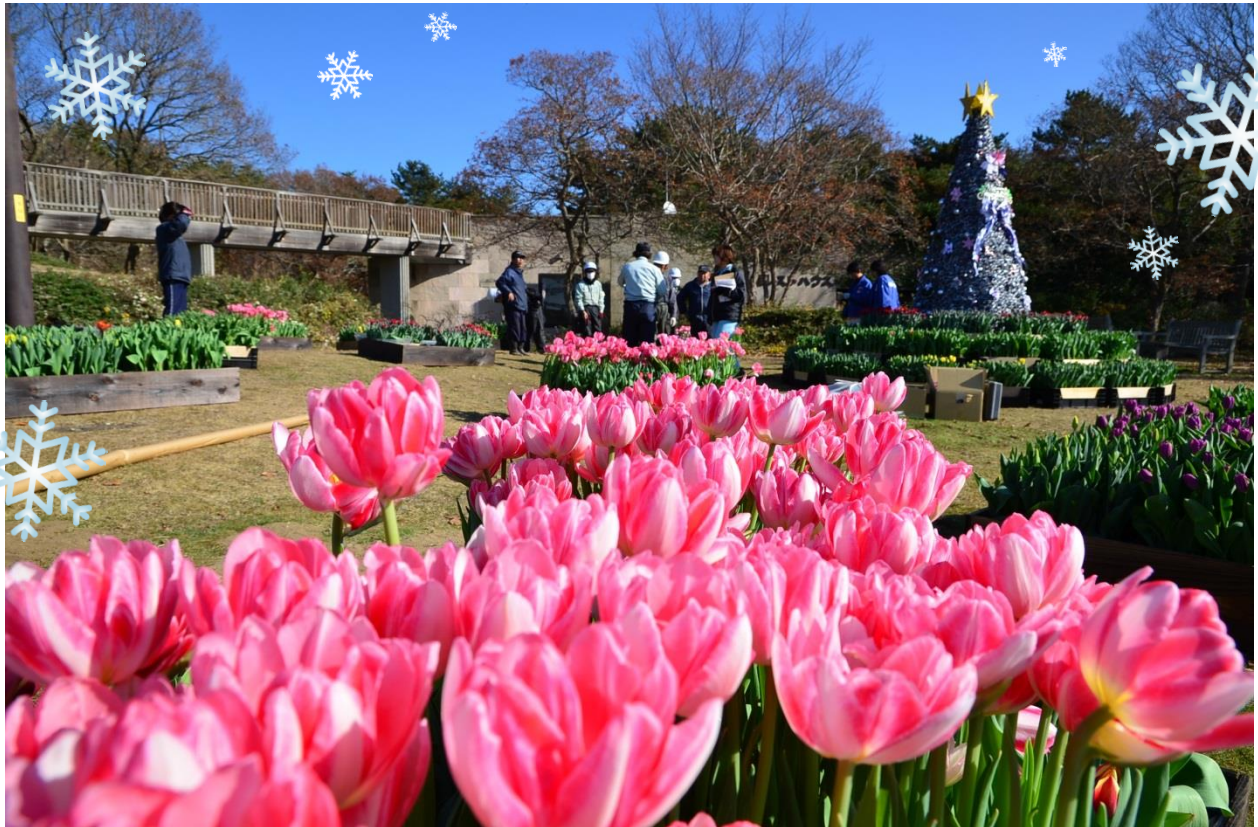
設置作業中のアイスチューリップ 2013年12月5日撮影

紅葉の季節が終わり、次の楽しみは春の花々…と思われがちですが、実はひたち海浜公園では、冬も可憐な花たちが皆様をお出迎えします。そのメインとなるのが、冬に咲く「アイスチューリップ」。今年は12月7日(土)より、 15品種約15,000本を「記念の森レストハウス」周辺に展示 します。春の「たまごの森フラワーガーデン」のような一面に咲く華やかさとは趣が異なり、アイスチューリップは植栽する間隔をぎゅっと密にし、まるでキュートな花束のよう。ピンクや黄色など色とりどりのチューリップと松ぼっくりで装飾したツリー、そして森の中のカフェテラス。絵本のような世界がお楽しみいただけます。