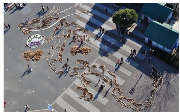
2012年「辰」復興と飛躍をイメージした巨大な「昇龍」。