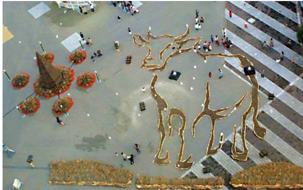
2009年「丑」デザインテーマは茨城が誇るブランド牛「常陸牛」。