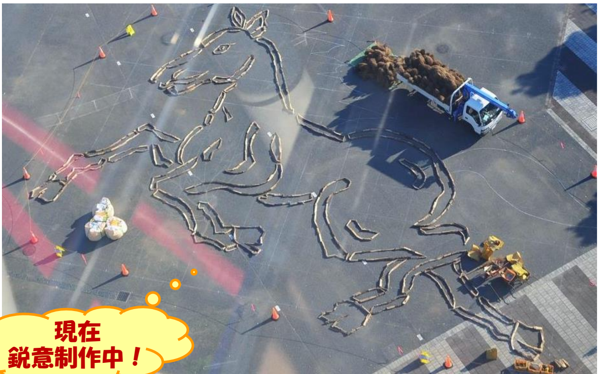
制作中の巨大地上絵 2013年12月5日撮影

師走に入り、カレンダーも残すところあと一枚となりました。プレジャーガーデンではクリスマスソングが流れ、ひたち海浜公園にも年末ムードが漂っています。