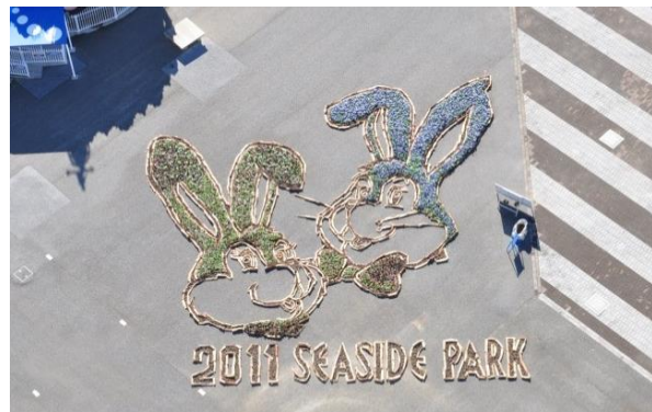
2011年「卯」花と松ぼっくりで作った本公園のキャラクター「海くん・花ちゃん」。