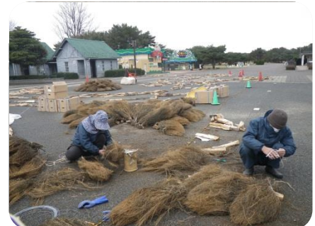
コキアを使用し、たてがみと尻尾を表現

2014年のテーマは 「翔ける」 「より力強く前進していく」年になることを 願っています。