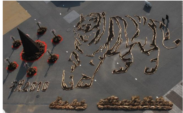
2010年「寅」巨大地上絵2年目、すっかり本公園の定番となりました。