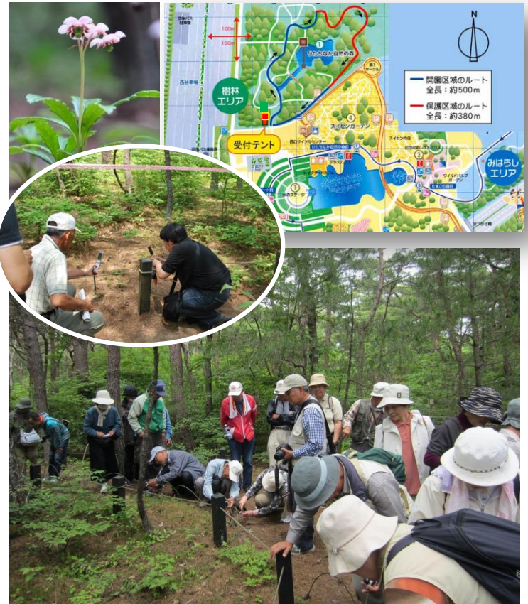
昨年の開催風景 2012年6月14日撮影