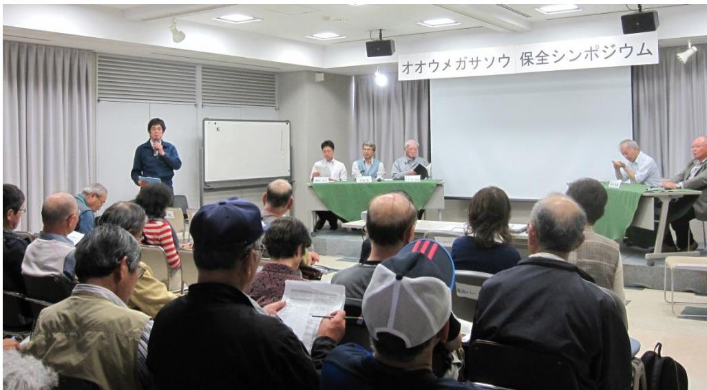
昨年の開催風景 2012年6月17日撮影

公園での現状やオオウメガサソウの貴重性、生育環境保全の重要性等をより多くの方々に知っていただくため、地元茨城で希少種の調査・保護活動を行っている茨城生物の会や専門家による講話や海浜公園のボランティアの里山パートナーからの調査報告等で構成するシンポジウムを開催します。オオウメガサソウやその生育環境に対する理解を深めていただきたいと思ひます。