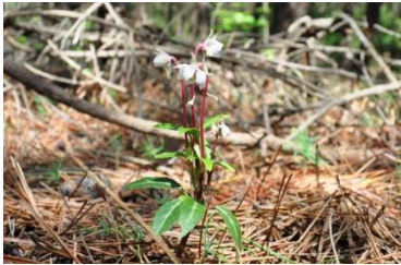
ひたちなか自然の森で同時期に咲く花

貧栄養な砂質土壤に地下茎を深く伸ばして、松の根共生菌と共生しています。小さな姿ですが立派な常緑樹、樹木の仲間・低木です。