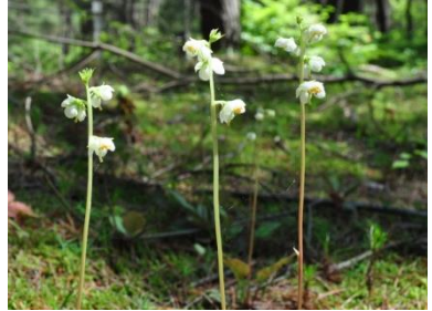
ウメガサソウ（左） イチヤクソウ（右） 2012年6月10日撮影