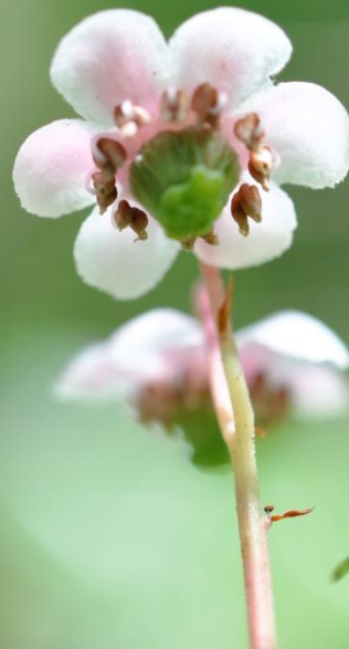
『オオウメガサソウ』 ひたちなか自然の森 特別保護区にて 2012年6月27日撮影

国営ひたち海浜公園は、長い間軍用地として使用されていたため手付かすの自然が残っており、また本公園の面する太平洋沖合は、寒流と暖流がぶつかる場所であることから、園内には生息域が北限或いは南限に近い生物が混在しています。中でも“オオウメガサソウ”は、本公園が日本の南限地とされており、茨城県版レッドデータブックでは絶滅危惧種に指定、環境省レッドデータブックでも準絶滅危惧種に指定されている大変貴重な植物です。