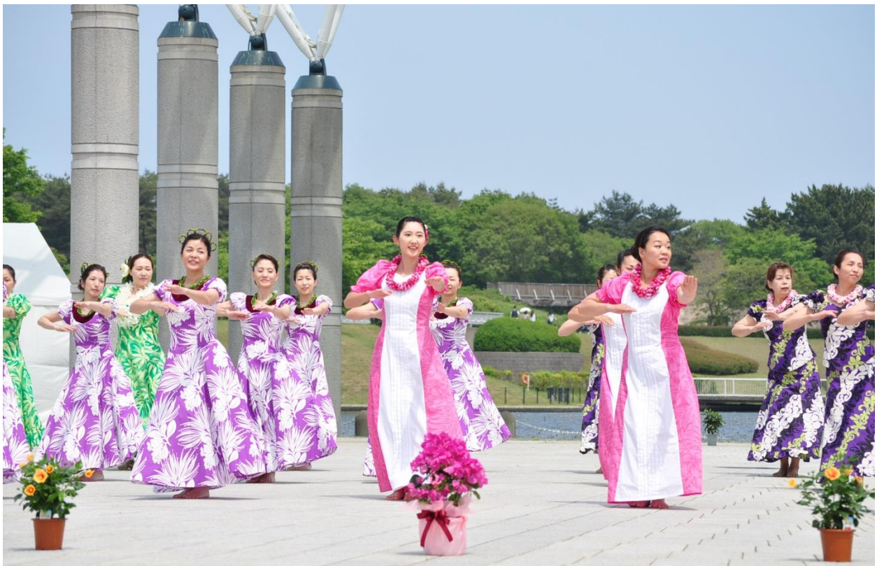
昨年の開催風景 (2012年5月20日撮影)

5月26日(日)に、当公園で『ひたちなかフラフェスティバル』を開催いたしますのでご案内いたします。 すり鉢状の広場、そして池をバックにした石張りのステージ、全長約30mのガラス製アーチが設置された“水のステージ” を舞台に繰り広げられる、 フラ愛好家約1,500人による茨城県最大級のフラエキシビジョン です。太陽と大地の恵みに感謝し、潮風を感じながら舞うフラをお楽しみ下さい。