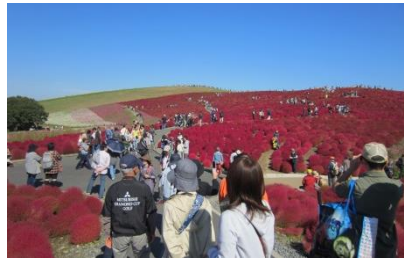
みはらしの丘（2012年10月20日撮影）