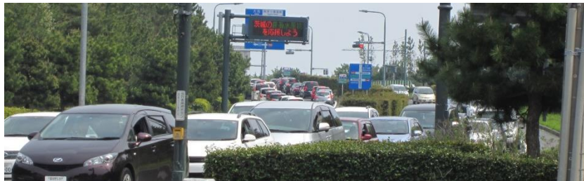
公園駐車場に向かう車の渋滞の列（2012年4月29日撮影）