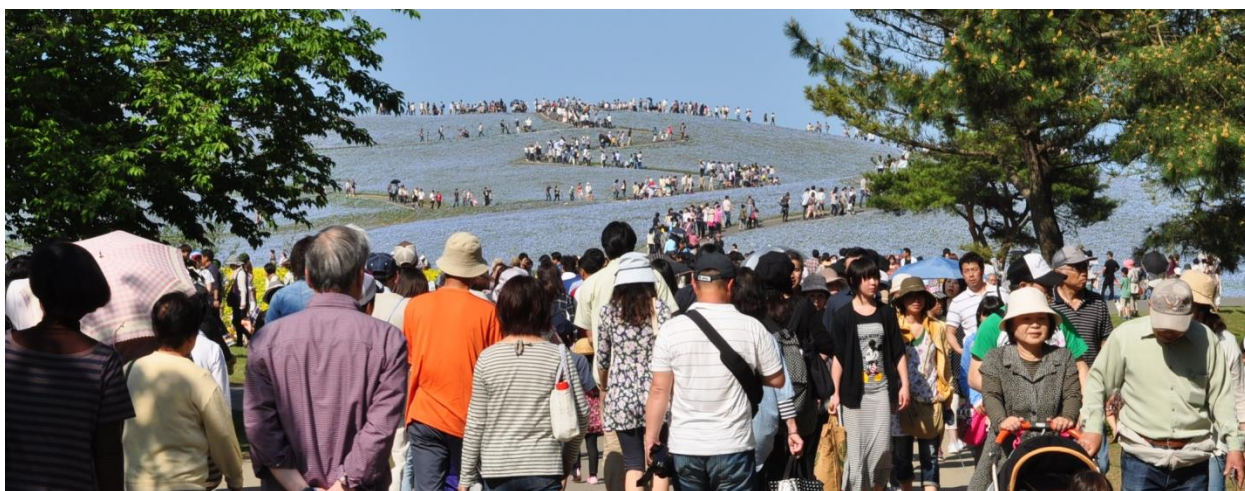
多くの入園者で賑わう“みはらしの丘”（2012年5月5日撮影）

今年度から運営組織も変わり“ひたち管理センター”も新体制となりなりました。今後も、新しい取り組みやサービスを提供するとともに、自治体及び周辺施設と協力し、地域全体の復興を目指して公園運営に努めてまいりますので、引き続き取材並びに記事掲載の程よろしくごお願い申し上げます。